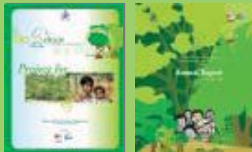
Project Glance - A pictorial report on developmental interventions.