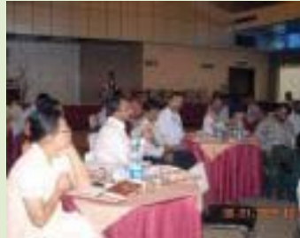
ପରିଚାଳନା କେନ୍ଦ୍ରର ଅଧିକାରୀମାନେ ସହାୟତା ଦେବେ ।

ପ୍ରକଳ୍ପ ଲକ୍ଷ୍ୟ ପରିପ୍ରେକ୍ଷୀରେ ସ୍ୱୟଂ ସହାୟକ ଗୋଷ୍ଠୀର ଭାଗିଦାରୀ ଓ ବିକାଶ ତଥା ଦୈନନ୍ଦିନ କାର୍ଯ୍ୟ ତଦାରଖ କରିବାକୁ ସହଯୋଗୀ ସ୍ୱେଚ୍ଛାସେବୀ ସଙ୍ଗଠନକୁ ଦାୟିତ୍ୱ ପ୍ରଦାନ କରାଯାଇଛି, ଏଥିରେ ସେମାନଙ୍କୁ କ୍ଷେତ୍ର