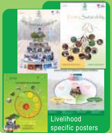
Livelihood specific posters