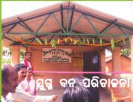
Dimirimunda VSS Building