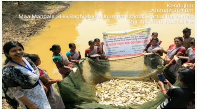
ବାଘିଆନସା ବନ ସୁରକ୍ଷା ସମିତିର ମହିଳା ସ୍ୱୟଂ ସହାୟିକା ଗୋଷ୍ଠୀ ସଦସ୍ୟାମାନଙ୍କ ଦ୍ୱାରା ମିଳିତ ଛତୁ ଚାଷ ଓ ମାଛ ଚାଷ