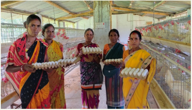
ବିକ୍ରୟ ପାଇଁ ଅଣ୍ଡା ସଂଗ୍ରହ