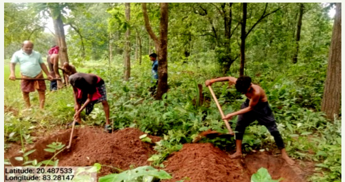
ବଲାଙ୍ଗୀର ବନଖଣ୍ଡର ସଇଁତଳା ବନାଞ୍ଚଳ ଅନ୍ତର୍ଗତ ଶୁଳିଆମାଳ ବନ ସୁରକ୍ଷା ସମିତିରେ ମୃତ୍ତିକା ଓ ଆର୍ଦ୍ରତା ସଂରକ୍ଷଣ କାର୍ଯ୍ୟର ରକ୍ଷଣାବେକ୍ଷଣ