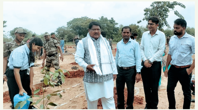
ଭାରତର ମାନ୍ୟବର ଆଦିବାସୀ କଲ୍ୟାଣ ମନ୍ତ୍ରୀ ଶ୍ରୀଯୁକ୍ତ ଜୁଏଲ ଓରାମଙ୍କ ଉପସ୍ଥିତିରେ ରାଉରକେଲା ବନଖଣ୍ଡର ମୁଣ୍ଡାତୋଳା ବନ ସୁରକ୍ଷା ସମିତିରେ ବନମହୋତ୍ସବ ପାଳନ