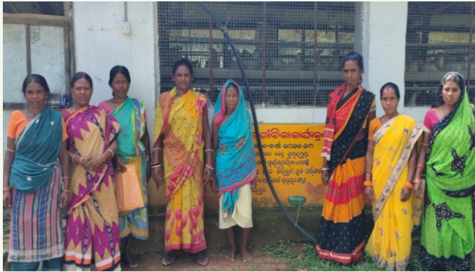
କୁକୁଡ଼ା ଫାର୍ମରେ ମହିଳା ସ୍ୱୟଂ ସହାୟକା ଗୋଷ୍ଠୀର ସଦସ୍ୟମାନେ