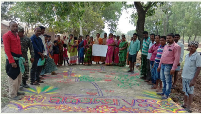
ବାଘିଆନସା ବନ ସୁରକ୍ଷା ସମିତିରେ ଗ୍ରାମବାସୀ ମାନଙ୍କ ସହଭାଗୀତା ରେ ବିସ୍ତୃତ ଆଣ୍ଡ ଯୋଜନା ପ୍ରସ୍ତୁତି