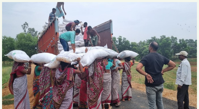
ବନ ସୁରକ୍ଷା ସମିତି ଓ ମହିଳା ସ୍ୱୟଂ ସହାୟିକା ଗୋଷ୍ଠୀ ସଦସ୍ୟାମାନେ ସାମୂହିକ ବିକ୍ରୟ କେନ୍ଦ୍ର ତଥା ନବ ନିର୍ମିତ ବନ ସୁରକ୍ଷା ସମିତି ଗୃହରେ ଜିଆଖତ ବିକ୍ରି କରୁଛନ୍ତି