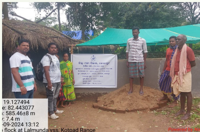
19.127494 e: 82.443077 r: 585.46±8 m r: 7.4 m -09-2024 13:12 flock at Lalmunda vss, Kotpad Range

“ହଳଦୀ ଚାଷ ଯେ କେବଳ ଆମ ପରିବାରପାଇଁ ରୋଜଗାର ଆଣିନଥିଲା, ବରଂ ଆମକୁ କିଛି ବଡ଼ ଏବଂ ଭଲ କାମ କରିବାପାଇଁ ଆତ୍ମବିଶ୍ୱାସ ମଧ୍ୟ ଦେଇଥିଲା । ଆମେ ସମସ୍ତେ ମିଶି ଦେଖାଇ ଦେଇଛୁ ଯେ, କଠିନ ପରିଶ୍ରମ ଦ୍ୱାରା ଆମଭଳି ଏକ ଛୋଟ ଗାଁ ମଧ୍ୟ ବଡ଼ ପ୍ରଭାବ ପକାଇପାରେ” – ତଳଗୁଡ଼ା ସ୍ୱୟଂ ସହାୟକ ଗୋଷ୍ଠୀର ସଦସ୍ୟାମାନଙ୍କ ପରିଭାଷା ଏହିପରି ଥିଲା ।