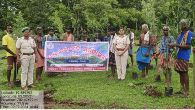
ନବରଙ୍ଗପୁର ବନଖଣ୍ଡ ଅନ୍ତର୍ଗତ ଧୋଦ୍ରା ସେକ୍ସନରେ ୧୫୦ଟି ବନମହୋତ୍ସବ ପାଳନ