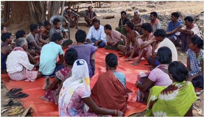
ଗ୍ରାମରେ ଜୀବିକା ଯୋଜନା ପ୍ରସ୍ତୁତି

ଗାଁରେ କେବଳ ଅନୁସୂଚିତ ଜନଜାତି ଓ ଅନୁସୂଚିତ ଜାତି ସମ୍ପ୍ରଦାୟର ଲୋକେ ବସବାସ କରୁଥିବା ବେଳେ ସେମାନଙ୍କ ମଧ୍ୟରୁ ଅଧିକାଂଶ ପରିବାର ଦାରିଦ୍ର୍ୟ ସୀମାରେଖା ତଳେ ଅନ୍ତର୍ଭୁକ୍ତ । ସେମାନଙ୍କର ଜୀବନ-ଜୀବିକା ନିର୍ବାହ ମୁଖ୍ୟତଃ ଚାଷ, ଛେଳି ପାଳନ, କ୍ଷୁଦ୍ର ଜଙ୍ଗଲ ଜାତ ଦ୍ରବ୍ୟ ସଂଗ୍ରହ ଏବଂ ଦୈନିକ ମଜୁରି ଉପରେ ନିର୍ଭର କରେ ।