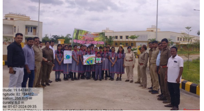
କଳାହାଣ୍ଡି ଦକ୍ଷିଣ ବନଖଣ୍ଡ ଅନ୍ତର୍ଗତ ଧରମଗଡ଼ ରେଞ୍ଜରେ ୧୫୦ଟି ବନମହୋତ୍ସବ ପାଳନ