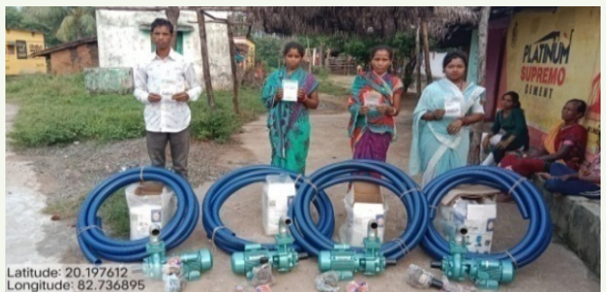
ଖରିଆର ବନଖଣ୍ଡ ଅନ୍ତର୍ଗତ ତାବରୀ ବନ ସୁରକ୍ଷା ସମିତି ସଭ୍ୟ ମାନଙ୍କୁ ପାଣିପଞ୍ଜୀକରଣ ସହାୟତା