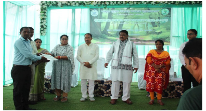
ରାଉରକେଲା ବନଖଣ୍ଡର ମୁଖ୍ୟଚୋଲା ବନ ସୁରକ୍ଷା ସମିତିକୁ ଜଙ୍ଗଲ ସୁରକ୍ଷା ପାଇଁ ବିଜୁ ପଟ୍ଟନାୟକ ପୁରସ୍କାର ପ୍ରଦାନ କରୁଛନ୍ତି ମାନ୍ୟବର କେନ୍ଦ୍ର ଆଦିବାସୀ ବ୍ୟାପାର ମନ୍ତ୍ରୀ କୁଏଲ ଓରାମ