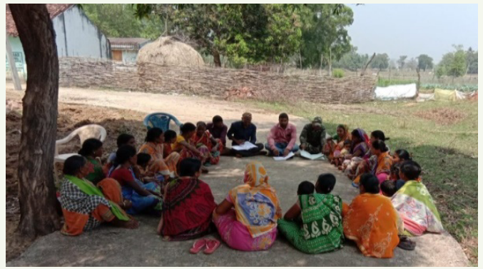
ବାଘିଆନସା ଗ୍ରାମର ମହିଳା ସ୍ୱୟଂ ସହାୟିକା ଗୋଷ୍ଠୀ ସଦସ୍ୟାଙ୍କ ଦ୍ୱାରା ଦୀର୍ଘସୂତ୍ରୀ ଜୀବିକା ବିକାଶ ଯୋଜନା ପାଇଁ ବୈଠକ