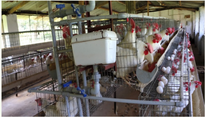
କୁକୁଡ଼ା ଫାର୍ମର ଭିତରର ଦୃଶ୍ୟ