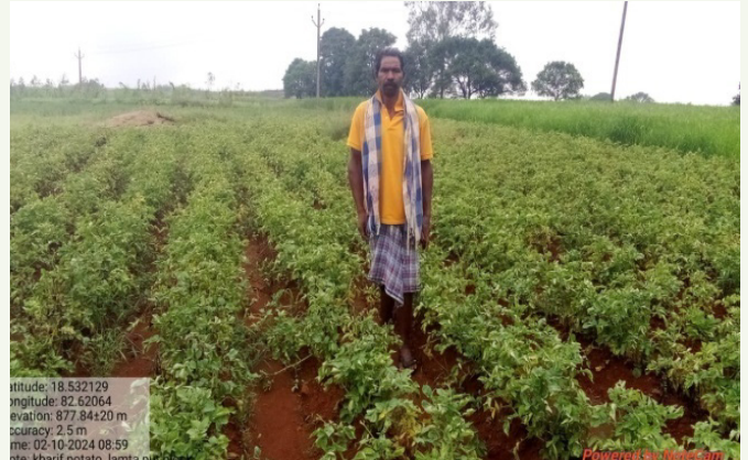
କୋରାପୁଟ ବନଖଣ୍ଡ ଅନ୍ତର୍ଗତ କେନ୍ଦୁପୁଟ ବନ ସୁରକ୍ଷା ସମିତିରେ ପନିପରିବା ଚାଷ ପାଇଁ ସହାୟତା