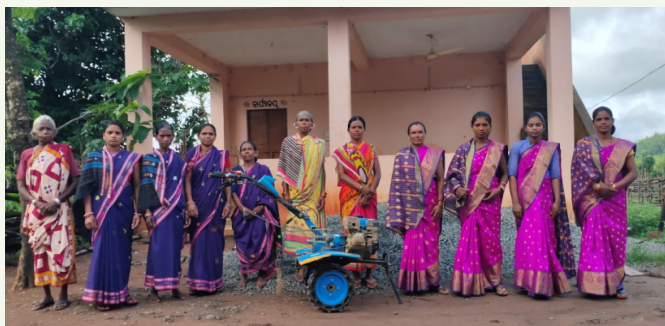
ବାଲିଗୁଡ଼ା ବନଖଣ୍ଡ ଅନ୍ତର୍ଗତ ସିଲିକୃଟି ବନ ସୁରକ୍ଷା ସମିତି ସଭ୍ୟ ମାନଙ୍କୁ ପାଣିପଞ୍ଜୀକରଣ ସହାୟତା