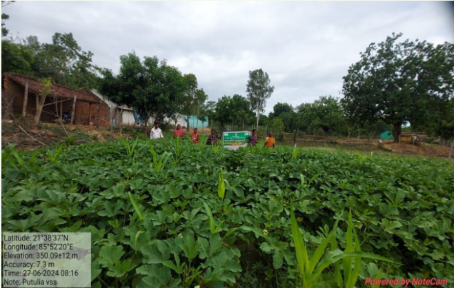
କେନ୍ଦୁଝର ବନଖଣ୍ଡ ଅନ୍ତର୍ଗତ ପୁଟୁଲିଆ ବନ ସୁରକ୍ଷା ସମିତିରେ ପନିପରିବା ଚାଷ ପାଇଁ ସହାୟତା